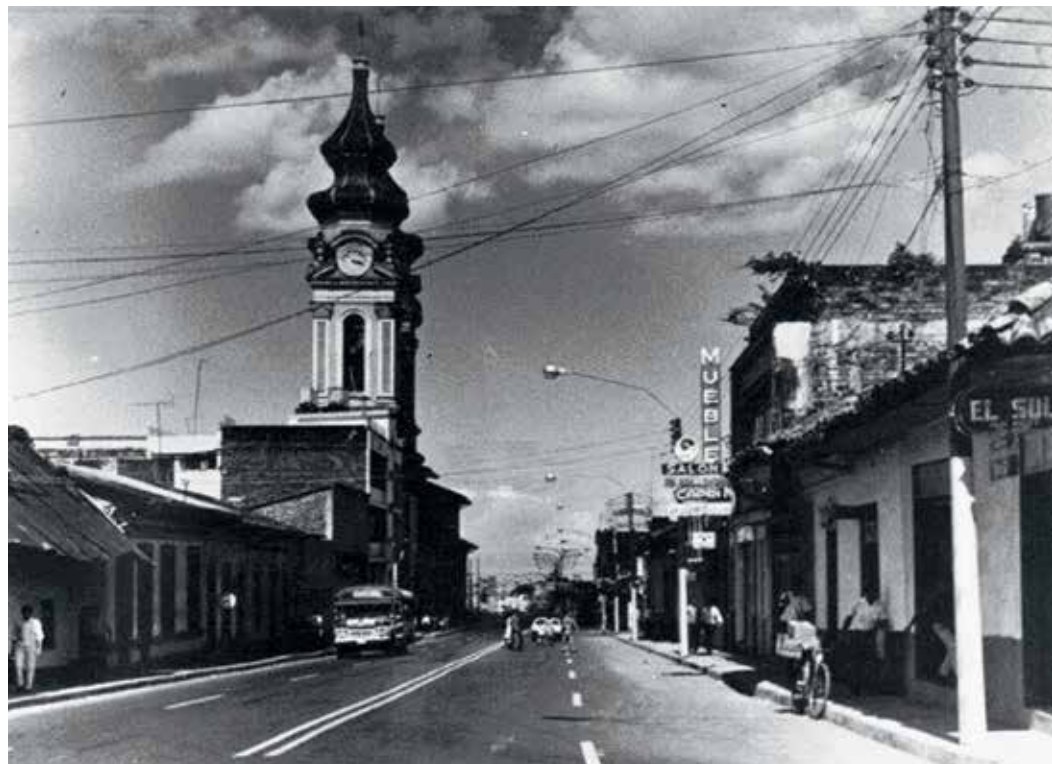
Fotografía Carrera Quinta, Camellom del Carmen

Ese es nuestro objetivo, consolidar en un documento estas memorias, narraciones y documentos para que sea de fácil acceso, así como atractivo para quienes nos ven.