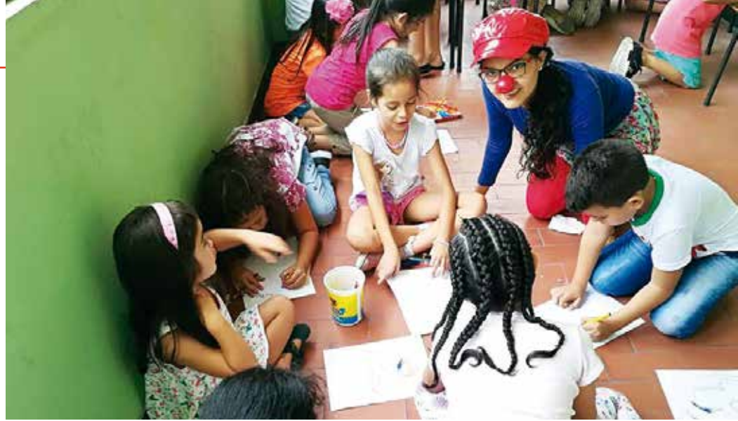
“Chispita” es el nombre de su personaje en clown, quien es la encargada de llevar sonrisas en la labor social.

Estas reacciones en el público no solo le han ocurrido en las obras de teatro sino que también en los sketches de las campañas educativas. Pues también recuerda y cuenta con agrado una anécdota que le ocurrió en el