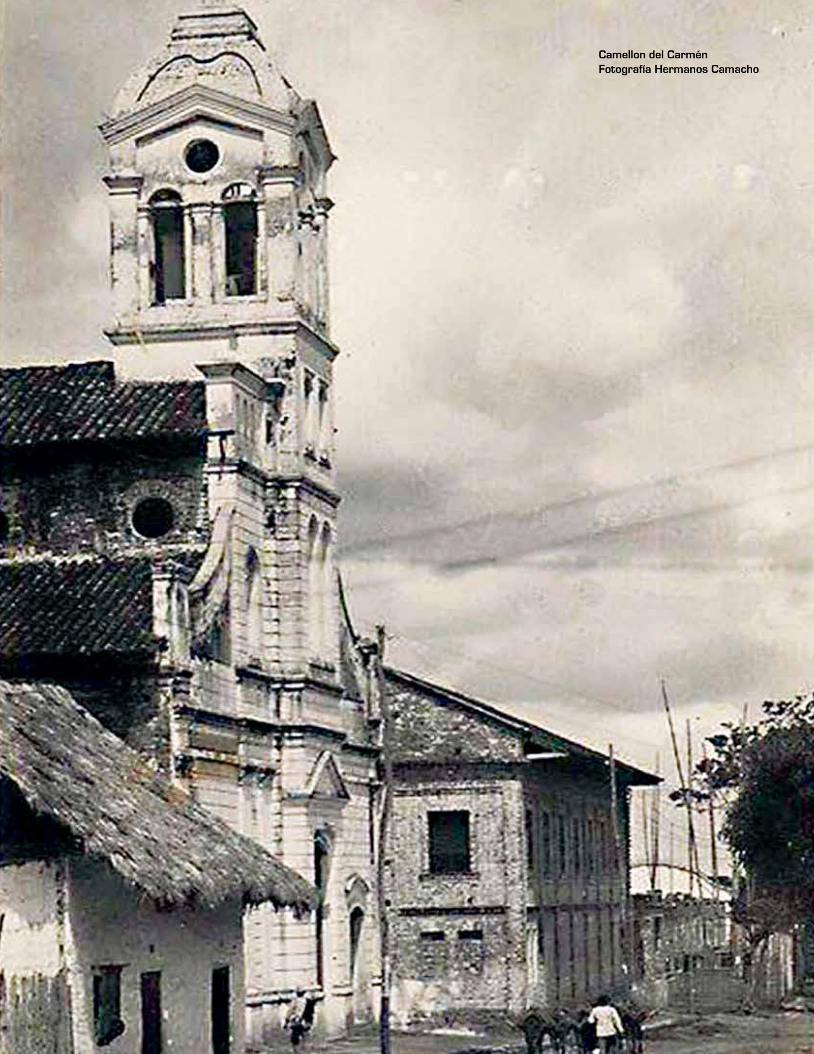
Camellon del Carmén