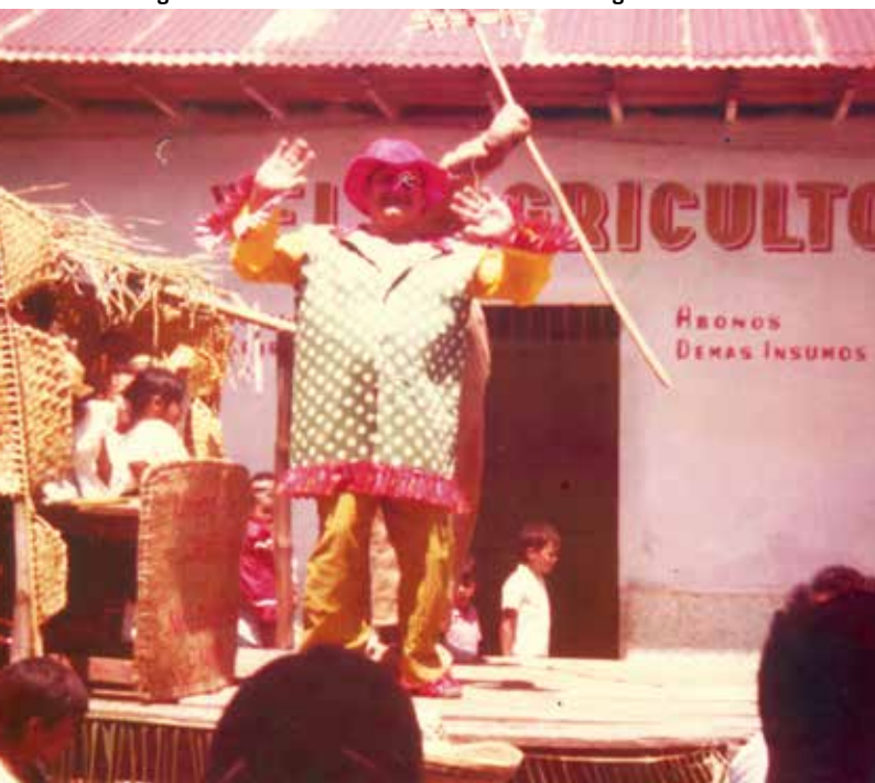
Celebraciones Natagaima