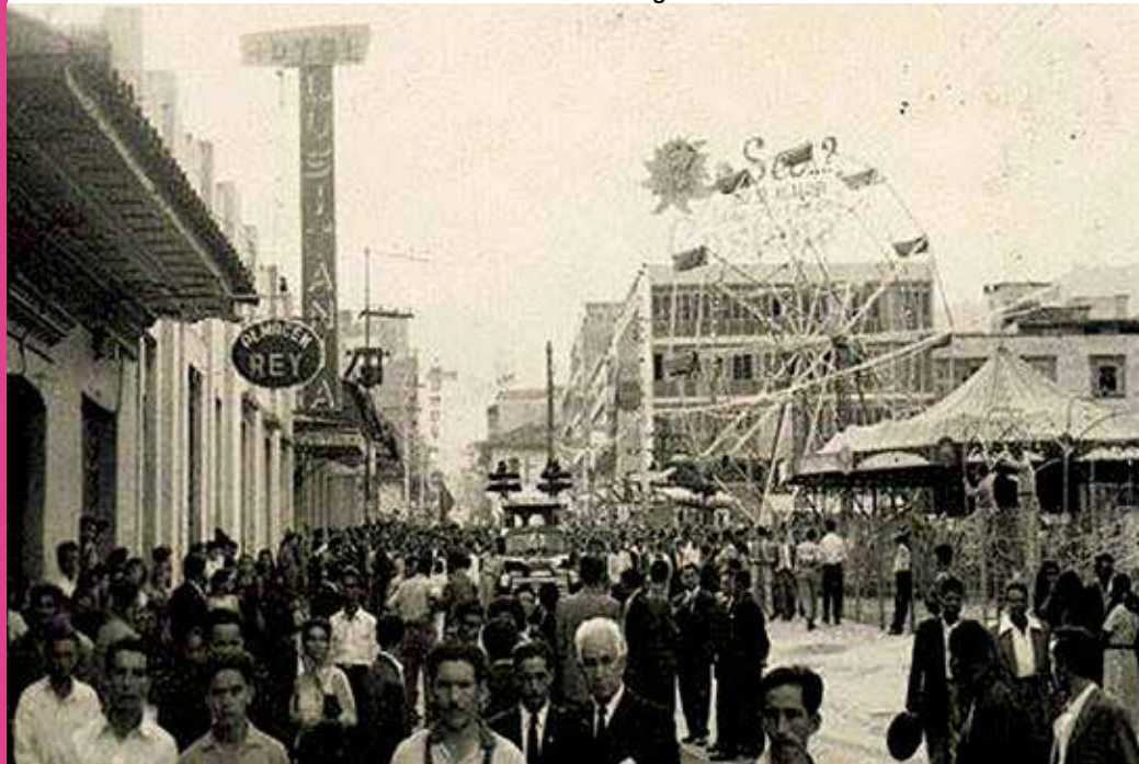
Fotografía Carrera Tercera año 1940

Lo importante de este proceso, es la consolidación de un público que va en aumento, mostrando interés por el programa, así como en aportar relatos y soportes para Esto es Ibagué.