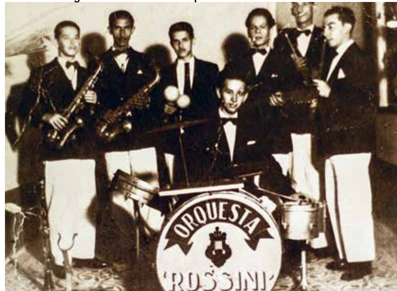
Orquesta Rossini - 1949 El Líbano