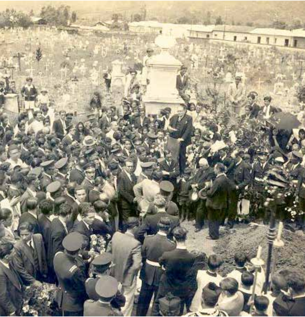
Cementerio Central calle 21 con carrera 4 frente a la estación Ospina. Honras fúnebres del General Maximiliano Neira Lamus.

Lo que en aquel tiempo fueran las inmediaciones de Ibagué, ubicación donde se encuentra lo que hoy es el Comando de Policía, en la carrera segunda con calle 21. El traslado se realizó en el año 1930.