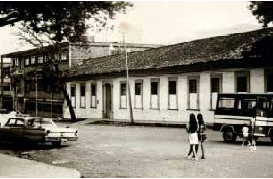
Antiguo lugar donde se ubicó sobre principios del Siglo XX el cementerio de Ibagué debido a la solicitud del Excelentísimo Monseñor Ismael Perdomo Borrero, obispo de Ibagué.

en 1550, que nace como la Villa de San Bonifacio de Ibagué del Valle de las Lanzas. El valle se encontraba entre el cerro de Doima, la cumbre de La Martinica, la serranía de San Juan de la China y las eminencias de La Cejita. Sin embargo, el área metropolitana, contaba con apenas algunas cuadras que rodeaban la actual plaza central, en donde se levantó la primera capilla del asentamiento, y cuyo primer párroco fue Francisco Antonio González Candis. En aquel lugar es donde se encuentra la ahora Catedral Primera de Ibagué. Junto a la capilla se ubicó un solar destinado a los primeros entierros, que posteriormente se convirtió en el cementerio público de la ciudad; terreno que al día de hoy se encuentra en lo que constituye la Capilla del Santísimo, anexa a la catedral.