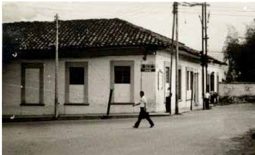
Antiguo lugar donde se ubicó sobre principios del Siglo XX el cementerio de Ibagué debido a la solicitud del Excelentísimo Monseñor Ismael Perdomo Borrero, obispo de Ibagué.

Posteriormente con la instauración de las medidas sanitarias implementadas por la Casa Real De los Borbones en 1770 en sus colonias, Ibagué adoptó la norma de ubicar su cementerio a las afueras de la ciudad. Siendo Ibagué aún tan pequeña, sus inmediaciones llegaban hasta la actual calle 15 y el cementerio fue reubicado en lo que