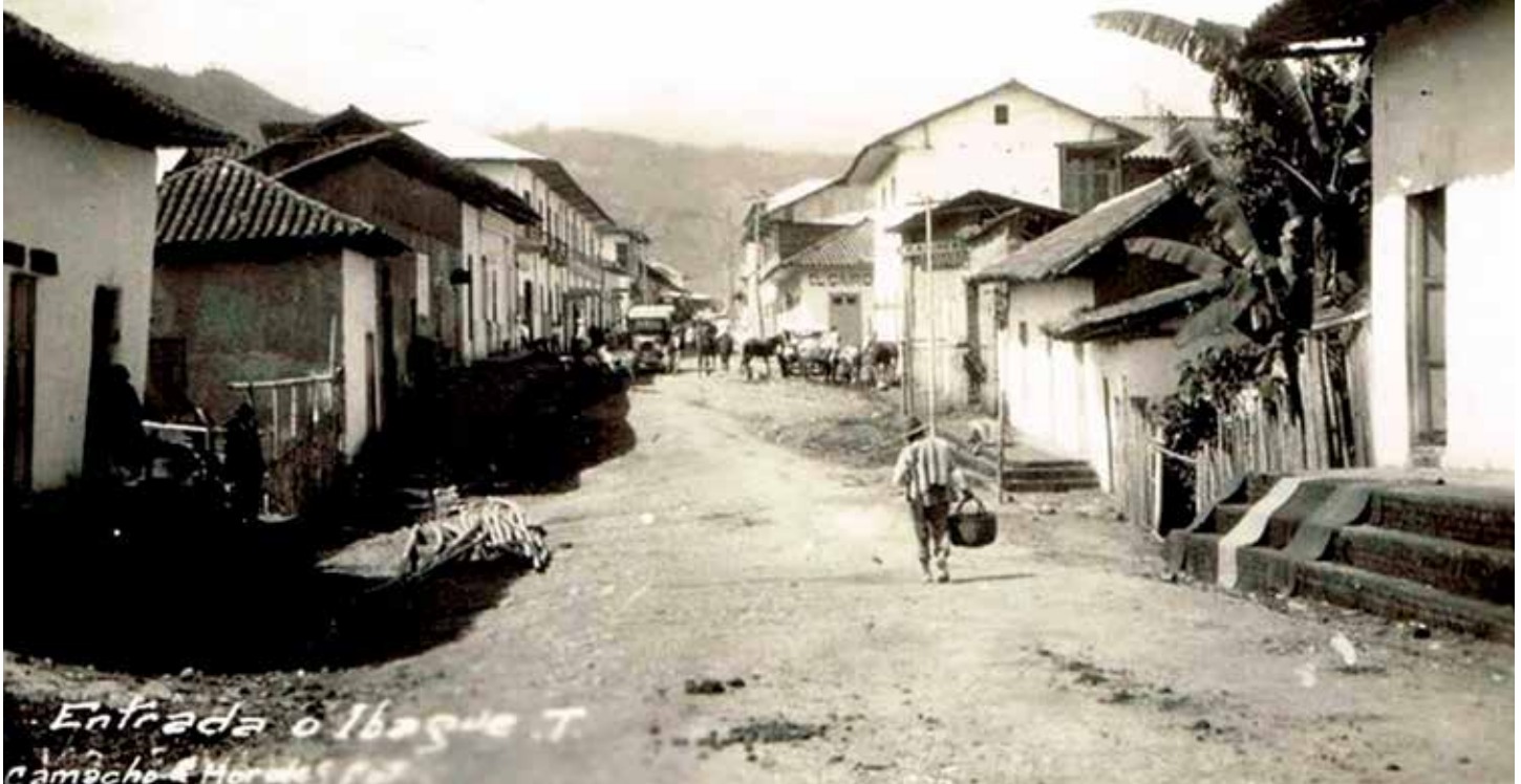
Fotografía Entrada a Ibagué Hermanos Camacho

Documentos que son testimonios que sobreviven al paso del tiempo, en el caso de específico de Ibagué, sus memorias dan cuenta de varias guerras federalistas, la guerra fratricida de Mil Días, violencia bipartidista, desastres naturales, entre otros hechos de impacto, que contrastan con la tradición cultural y musical de una ciudad que sigue en crecimiento.