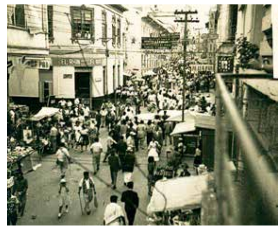
Fotografía Carrera Tercera con Calle 13 Año 1940

Por un tiempo se llegó a creer que el Conde de Gabriac y su paso por Ibagué, era una historia romántica para realzar el título de ciudad musical, sin embargo, en Esto es Ibagué confirmamos la existencia del personaje, y que no era conde, sino un seudónimo bajo el cual escribía sobre sus visitas a las colonias españolas.